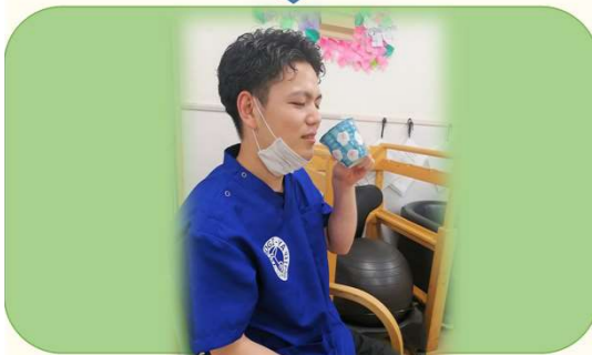
② 到着後、お茶で一息