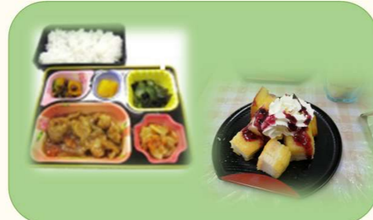
⑦ 午前の方は昼食 (12:00~12:40)