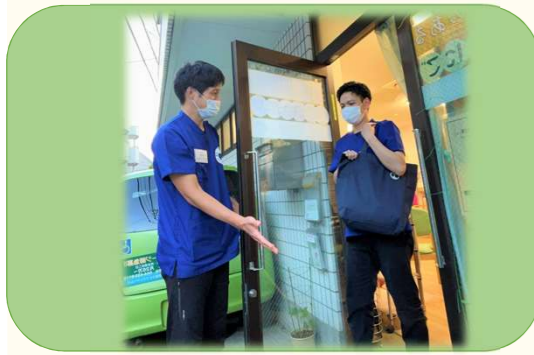
① 玄関前までお迎え