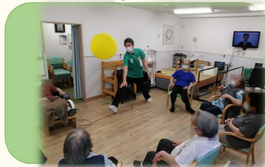
⑧ レクリエーションも盛り上がります!(風船バレー) 以上で終了です! お疲れ様でした! ご自宅へお送りして次回もお待ちしております! (午前12:40終了 午後17:00終了)