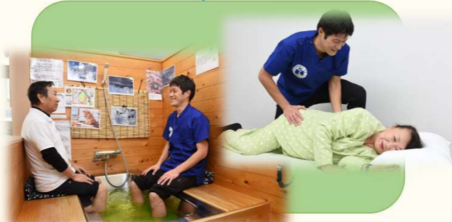
⑥ 合間に足湯とマッサージでホッと一息