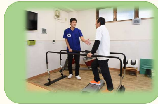
⑤ 個別機能訓練! 目標に応じた運動に取り組みます!