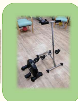
フィットネスバイク