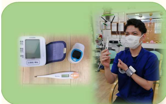
③ 健康チェック!(血圧・体温・脈拍)